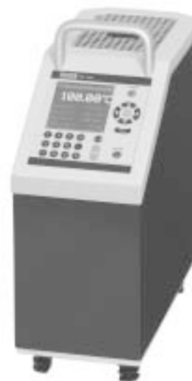
Сухоблочный термостат CTD 9300

Возможны две модели с различными измерительными диапазонами. Модель CTD 9300-160, воспроизводит температуры от -30 °С до 160 °С, что наиболее подходит в индустрии биотехнологий, также как в фармакологии и пищевой промышленности.