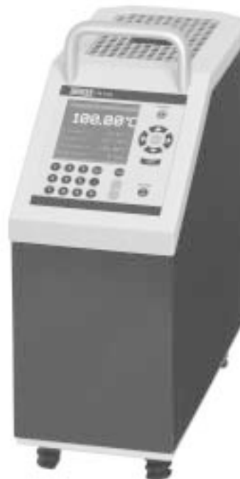
Сухоблочный калибратор температуры CTD 9300