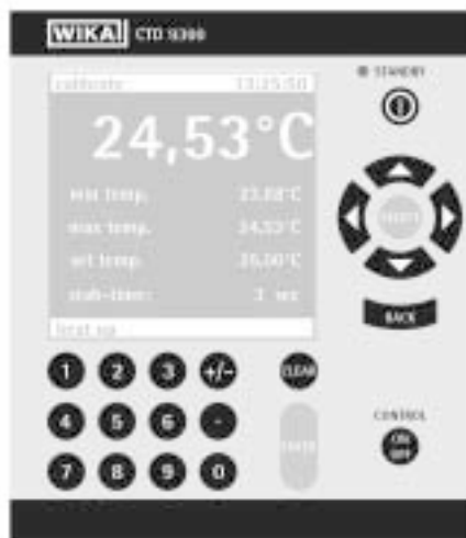
Меню измерений и калибровки

С измерительным прибором, который может встраиваться в существующие калибраторы, Pt 100, термопары и 4-20 мА токовый сигнал, можно измерять и переводить в температуры, также сличать с внешними термометрами сличения. Автоматическая калибровка возможна при использовании РС/ноутбук и калибровочного оборудования.