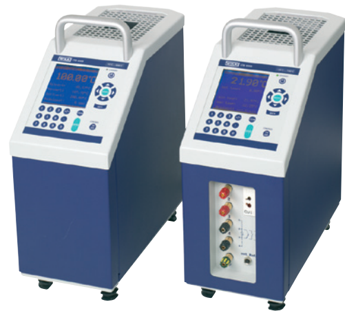
Calibradores de temperatura de bloque, modelo CTD9300