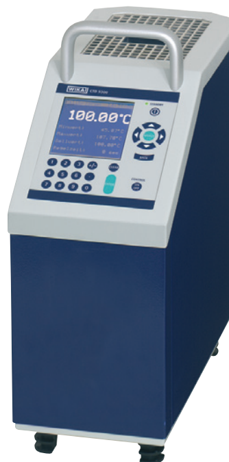
Calibrador de temperatura de bloque modelo CTD9300