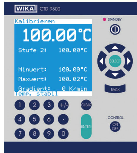
Menú de medición y calibración

Con el medidor integrable también posteriormente, pueden leerse Pt100, termopares y corrientes de 0/4 ... 20 mA y transformarse en temperaturas, también en comparación con un termómetro de referencia. Con un ordenador y el software de calibración se puede calibrar automáticamente.