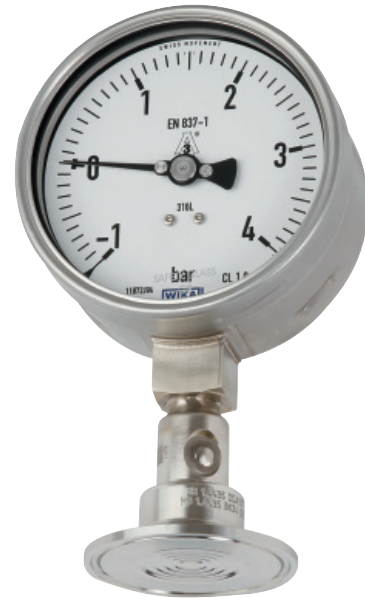
Система мембранных разделителей, модель DSS22F