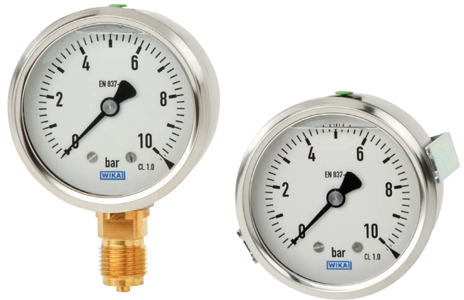
Fig. izqda.: Modelo PG21HD, conexión radial Fig. dcha.: Modelo PG21HD, conexión dorsal, con brida de fijación