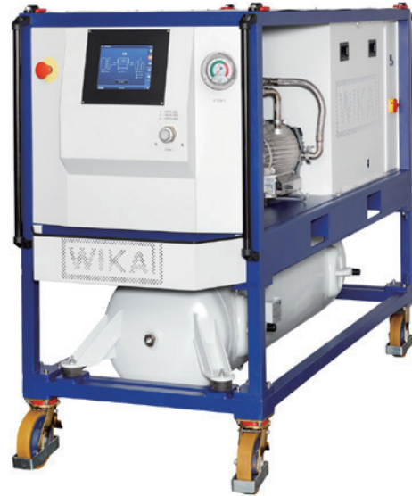
SF 6 服务设备，带 300 升空罐