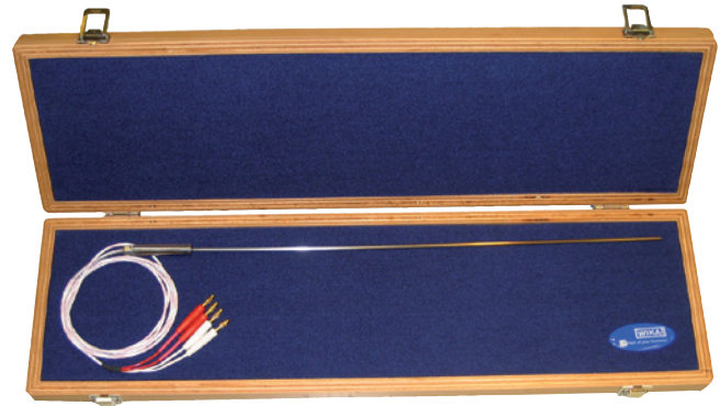
Termorresistência de platina modelo CTP2000