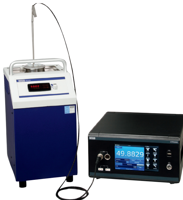
Modelo CTB9100 micro banho de calibração com modelo CTR3000 termômetro multifunção de precisão

Todas as rotinas de calibração podem ser reproduzidas para os processos de teste subsequentes.