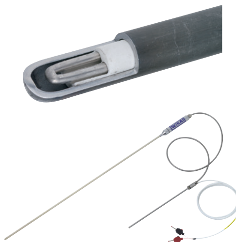
Termopar modelo CTP9000

Durante a medição, deve-se assegurar que os cabos de compensação do ponto de medição até a junta fria consistam em materiais substitutos que possuem, em uma faixa limitada de temperatura, as mesmas propriedades termoelétricas dos materiais do termopar. Portanto, nessa transição, não há tensão termoelétrica. Essa voltagem é gerada somente no ponto em que os cabos de compensação estão conectados a condutores de cobre normais.